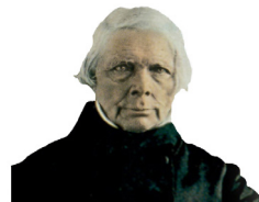
Internationale Schelling-Gesellschaft e.V.